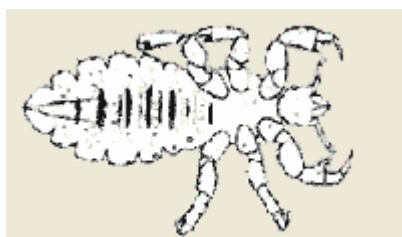
Hanlus, lidt mindre end hunlus